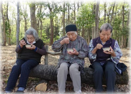
▽▲近くの自然公園まで遠足です