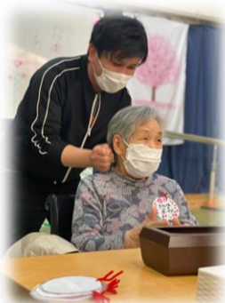
お疲れ様です！ （デイ母の日会から）