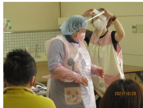
感染症対策講習会（さくら荘）

どんなに注意していても感染することや転倒事故につながることも…。各施設では定期的に処遇会議を開催。各委員会毎にテーマを設け、マニュアルの確認や利用者様との日頃の接し方について職員全員で考え、次なる行動に生かしています。