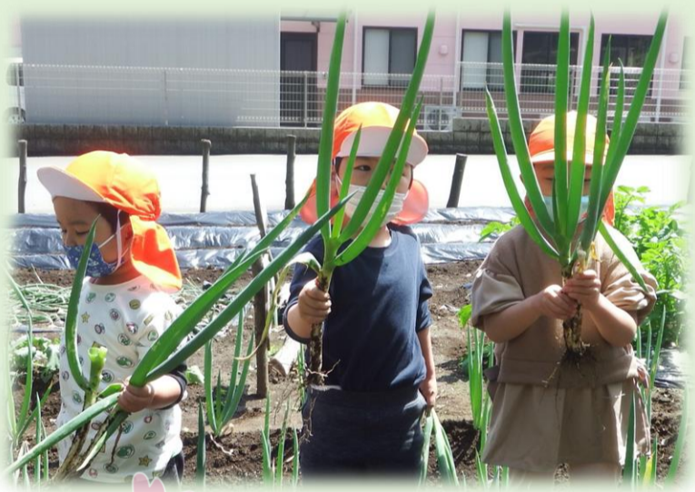
▼ネギの収穫☆給食の材料に! 自分たちで収穫した野菜はとってもおいしいよ!!