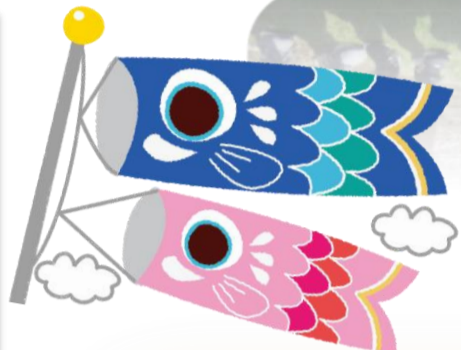
◀バスに乗って宮山ふるさとふれあい公園へ! 何色のこいのぼりがあったかな??