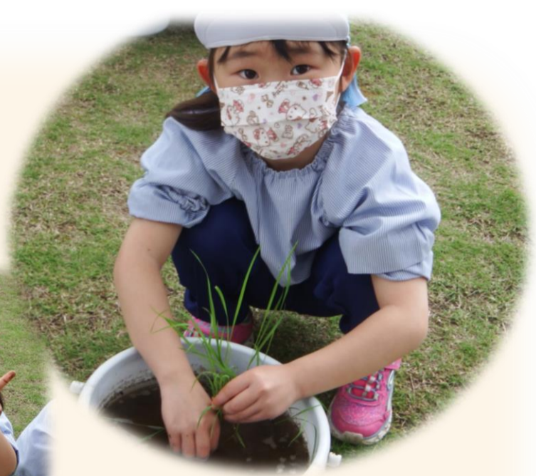
去年初めて試みたお米作り。今年もはじめました☆