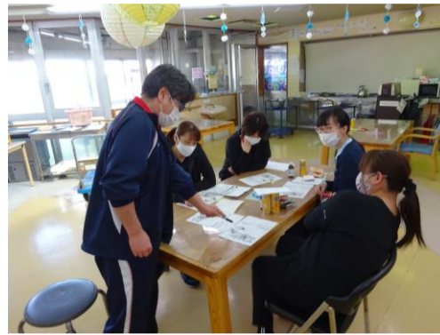
▲転倒防止の勉強会から