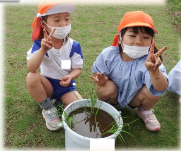
▲1つは「小鳥さんの分」 1つは「虫さんの分」 1つは「みんなの分」 バケツに3つ植えました☆