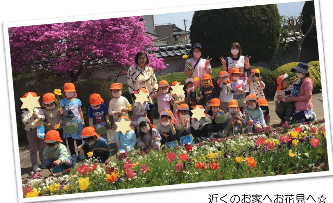
近くのお家へお花見へ☆