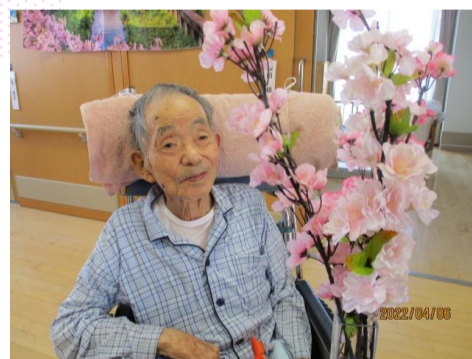
次回はお外に出ましょね （桜花と一緒に記念撮影/桜見会）