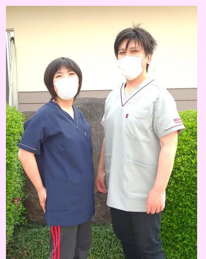
●創立30周年記念事業で制服を新調しました