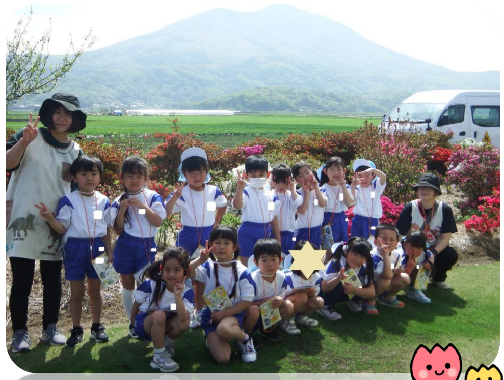
お花とってもきれいだったね!