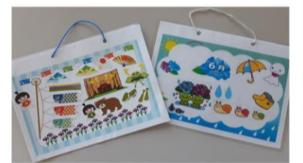
▲季節の貼り絵を皆さんで作製。ご自宅に飾っていただけます。

お母さんありがとう！ 今日という日によきことが訪れますように…。感謝を込めて心ばかりの品をプレゼント。（デイサービスの母の日会）