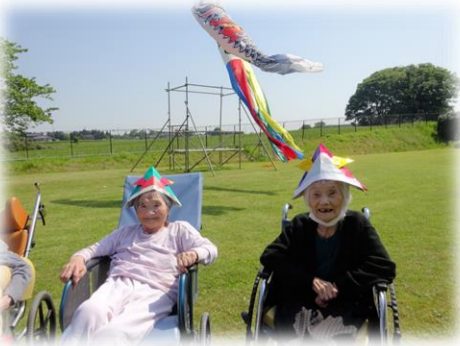
▽▲爽快ですね（鯉のぼり見学）