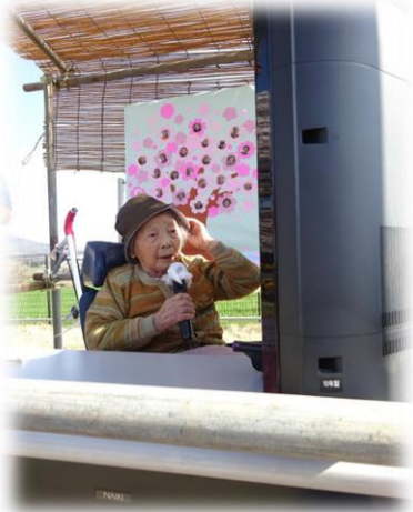
▲晴天に恵まれた桜見会