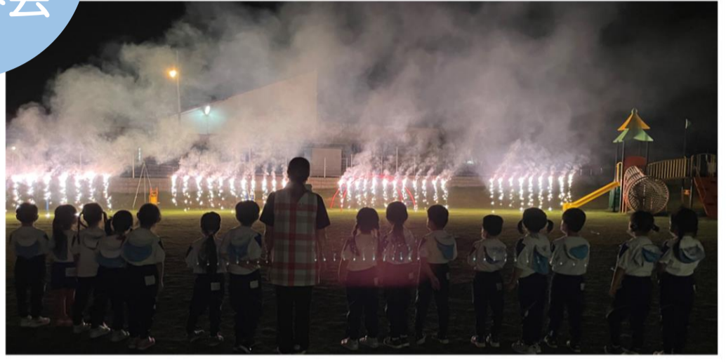
▲年長さん、みんなで見た花火は感動したね☆