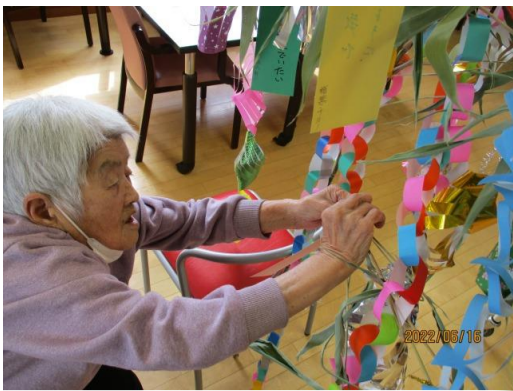
▲ディルームや各ユニットフロアに笹を用意、職員と一緒に飾り付けを楽しんでいただきました。