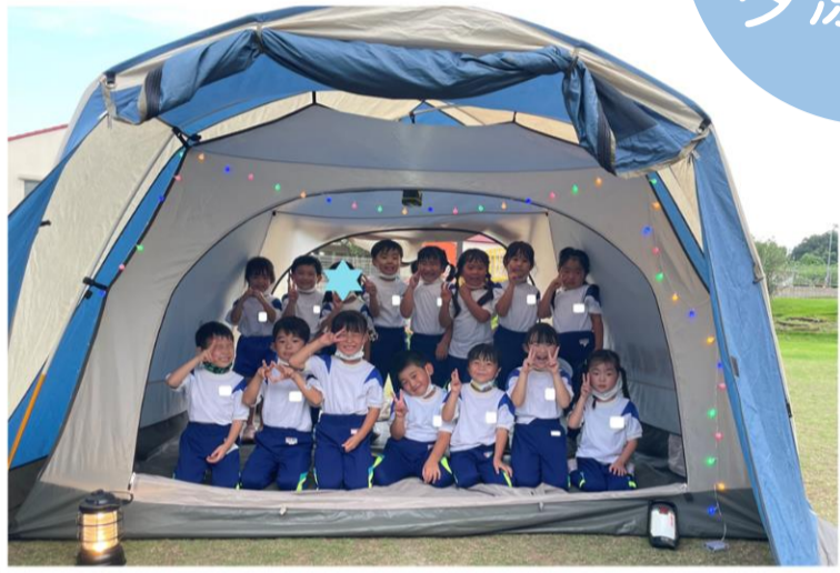
▲テントでキャンプ体験☆