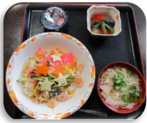
▲行事食も七ター色！！