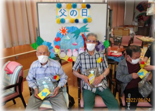
▲「母の日・父の日」記念すべき日には手作りの小物入れやお菓子をプレゼント。趣向を凝らしたゲームも楽しんでいただきました(ナイスショット!)

認知症はいろんな病気が原因で発症すると言われます。利用者様の症状も様々。その対応には、「日々の声掛け、環境づくり」が大切だそうです。