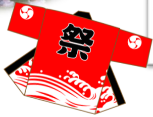
◀年長さんと柴先生による「ソーラン節」 カッコよかった！