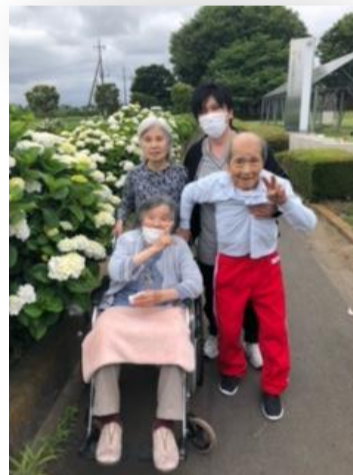
▶施設の皆さんは県生涯学習センターへ