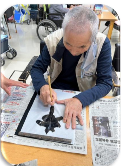
◀集中することでも体温を下げる効果が、(書道レクから)