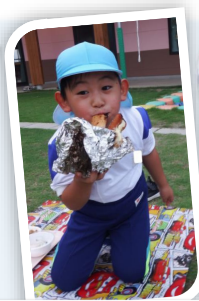
◀カートン ドック、 みんなで 作って食べ たよ☆