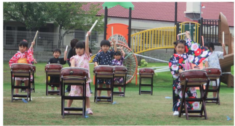
▲年中さん ▼年長さん による和太鼓！！ ばっちり決まっていたね☆