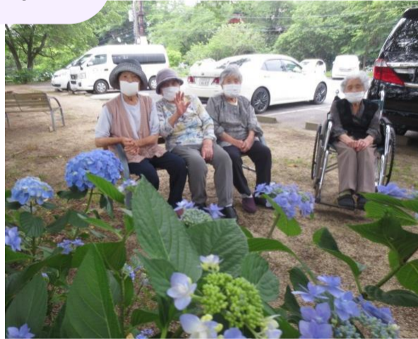
▲ディサービスの利用者は「あじさい寺」で気分転換