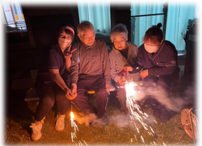
“線香花火”は郷愁を誘いますね。小学生の頃の夏休みを思い出しましたか？