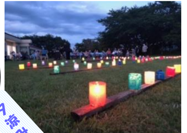
▲手作りのろうソク・ペットボトルやアルミ箔を有効活用。